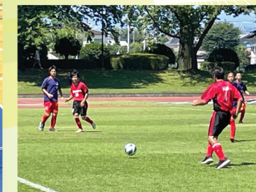
サッカー部 (ファイトカップ2022 群馬知的障害者サッカー大会)