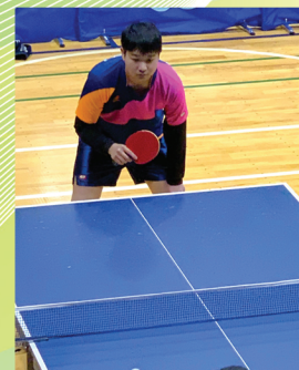
総合スポーツ部・卓球班 (令和4年度群馬県高校新人卓球大会)

バスケットボール部 バードウォッチング部 サッカー部 音楽部 総合スポーツ部 美術部