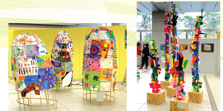
令和4年度 第28回ハートフルアート展「奨励賞」