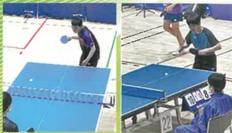
総合スポーツ部・卓球班 (令和8年度 群馬県高校総体)

バスケットボール部 バードウォッチング部 サッカー部 音楽部 総合スポーツ部 美術部