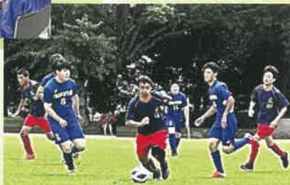
サッカー部 (ファイトカップ2024 群馬知的障害者サッカー大会)