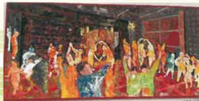
第31回 群馬県高等学校 総合文化美術・工芸部門展 優良賞